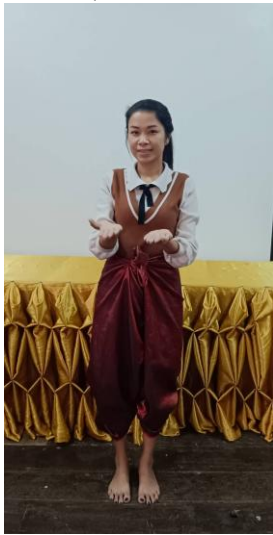
อนุบาลต้นแบบการศึกษามีวิชาให้ความรู้คู่วินัย