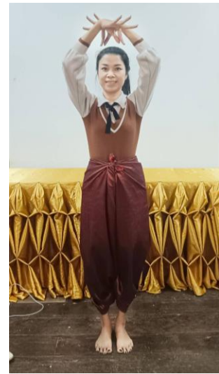
ดอกบัวน้อยยังคอยชูช่อ